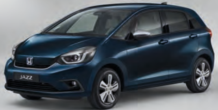
MIDNIGHT BLUE BEAM METALLIC