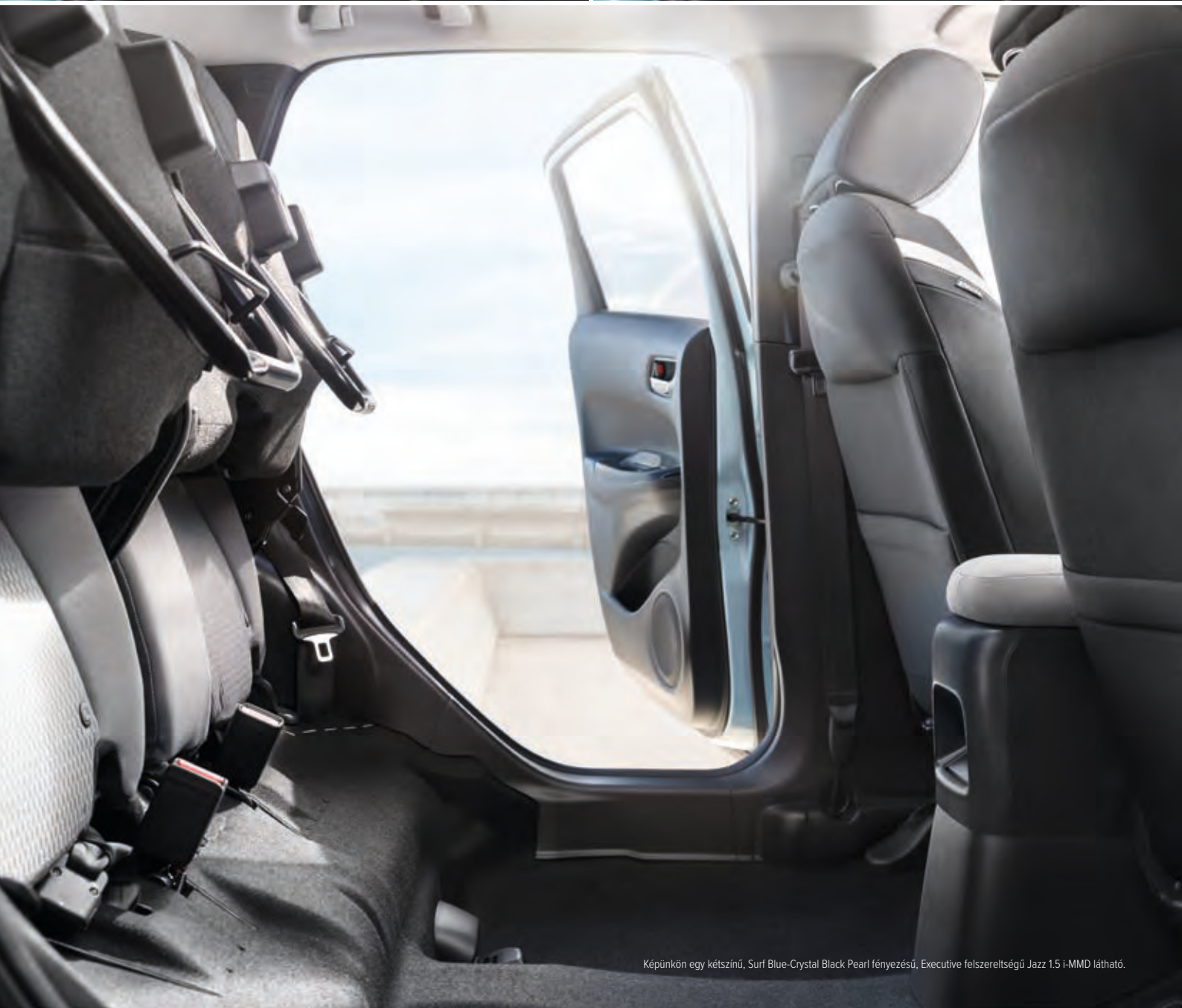
Képünkön egy kétszínű, Surf Blue-Crystal Black Pearl fényezésű, Executive felszereltségű Jazz 1.5 i-MMD látható.