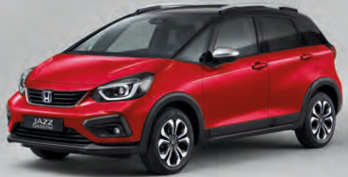
PREMIUM CRYSTAL RED METALLIC / KÉTTÓNUSÚ