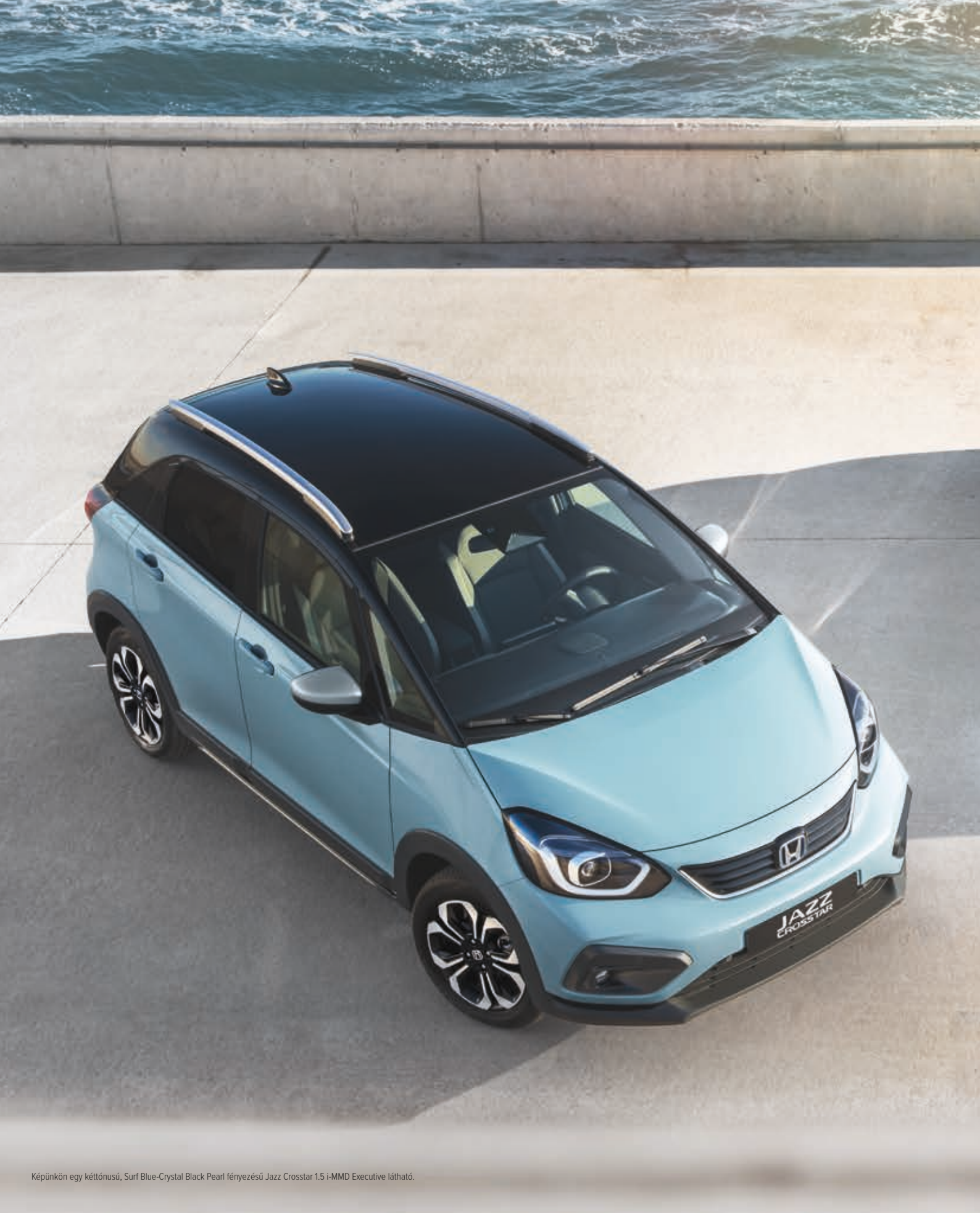
Képünkön egy kéttónusú, Surf Blue-Crystal Black Pearl fényezésű Jazz Crosstar 1.5 i-MMD Executive látható.