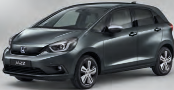
SHINING GRAY METALLIC