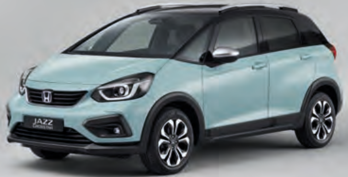
SURF BLUE / KÉTTÓNUSÚ