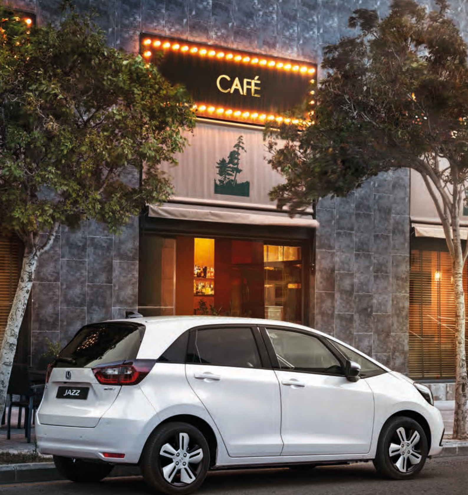
Képünkön egy Platinum White Pearl színű, Executive felszereltségű Jazz 1.5 i-MMD látható.