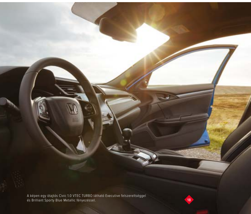
A képen egy ötajtós Civic 1.0 VTEC TURBO látható Executive felszereltséggel és Brilliant Sporty Blue Metallic fényezéssel.

A gondosan formázott, kiváló oldaltartású ülésekben helyet foglalva egyből kiderül, miért oly különleges a Civic beltére. A széles, letisztult műszerfal, a kezelőszervek felhasználóbarát, egyszerű kiosztása, a karosszéria átláthatósága és a páratlan hangulat minden szempontból lenyűgözi a vezetőt. Emellett a lehető leghatékonyabb szigetelőanyagokat és eljárásokat alkalmaztuk, hogy minél békésebb, csendesebb legyen az utastér, Ön pedig a lehető legnagyobb nyugalomban autózhasson.