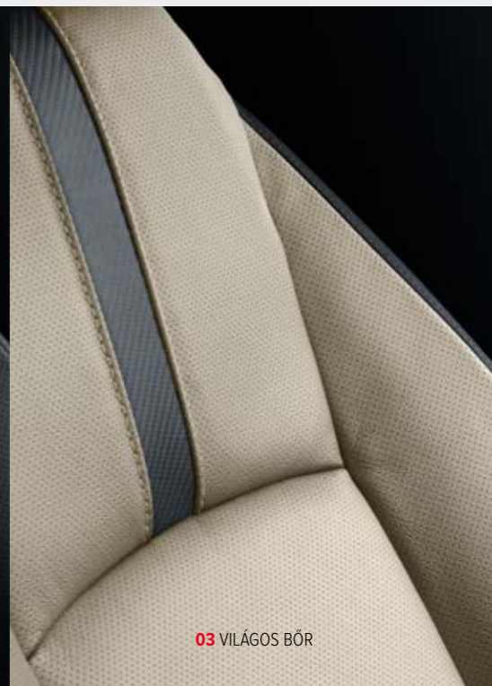
03 VILÁGOS BŐR